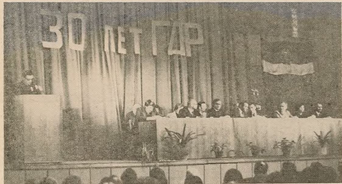
ДА 30-ГОДДЗЯ ГДР

Вялікую ролю ў прыцягненні студэнтаў да псіхалагічнай навукі іграе існуючы на кафедры гурток «Псіхалаг». У гуртку студэнты знаёмяцца з метадамі псіхалагічнай дыягностыкі, вывучаюць методыку аўтагеннай трэніроўкі, выступаюць з навуковымі дакладамі. Студэнты, авалодаўшы методыку аўтагеннай самарэгуляцыі, навучыліся пазбаўляцца ад непатрэбнага на экзаменах хвалявання, лёгка сканцэнтравана ўвагу на вучэбнай дзейнасці, папярэджаць і здымаць стомленасць, у іх палепшыліся паказчыкі некаторых псіхічных функцый, неабходных для паспяховай вучобы. Марына Мажэйка і Іры-